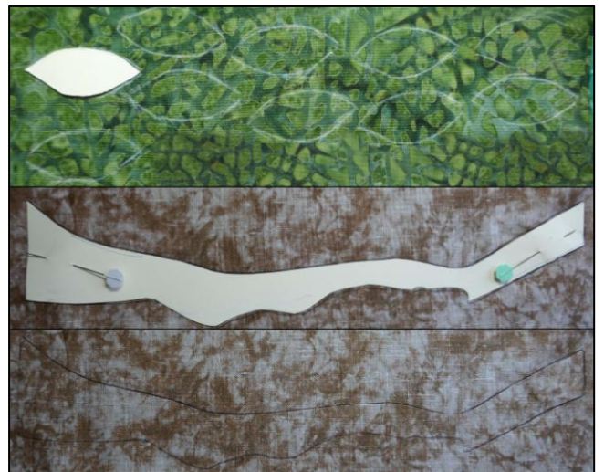
marquage sur le tissu