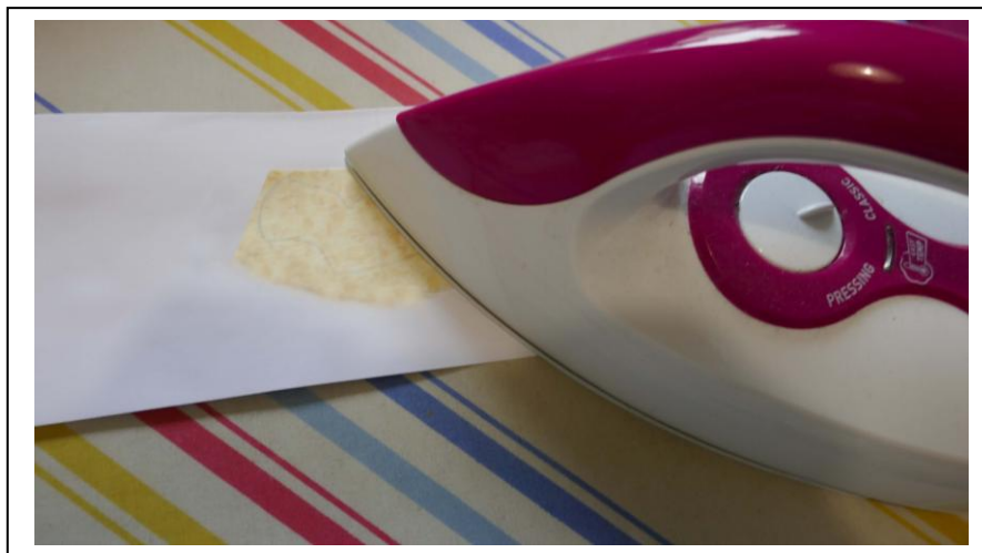
Collage à sec sur le vliesofix