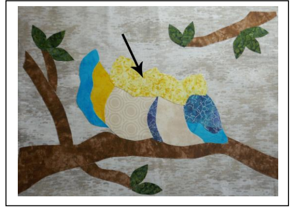
Collage du motif sur le tableau