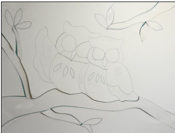
Dessin et découpe