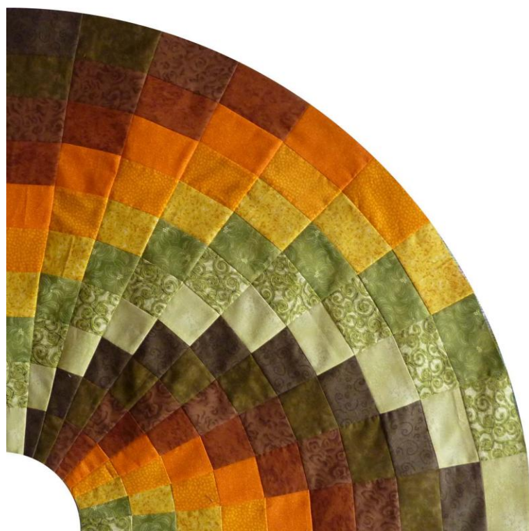
Un quart de cercle

PS : la nappe finie mesure 132 cm de diamètre. Si on la veut plus petite, réduire la largeur des bandes au départ et placer la règle à 9^\circ plus haut au moment de la coupe.